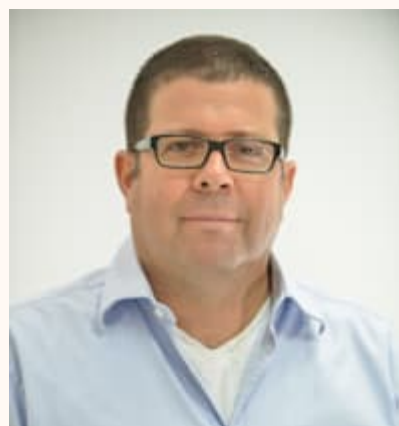
פרופ' יורם רבין, נשיא המכללה למינהל / צילום: עידן גרוס

גם במכללה למינהל יש שופטים מכהנים ובדימוס המלמדים משפטים. נשיא המכללה, פרופ' יורם רבין, שגם כיהן כדיקן הפקולטה למשפטים, אומר כי הוראת שופטים מכהנים במוסדות האקדמיים מקובלת מ-1948 ועד היום, וגם מקובלת בפקולטות למשפטים בחו"ל. רבין מדגיש את החשיבות של השתתפות שופטים מכהנים באקדמיה.